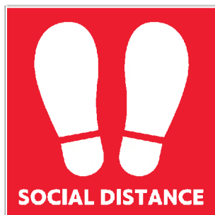
フロアシール(足型)