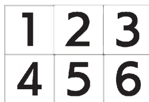
番号シール 4 シート入/袋 (T)200mm×(Y)300mm